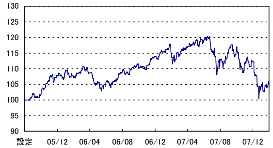
ユニットプライス 104.07

ユニットプライスは小数点第3位以下を切捨てて表示しております。前月比及び期間別騰落率(%)は、前記のユニットプライスで計算し、小数点第3位を四捨五入しております。