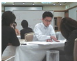
研修風景（ロールプレイング）

平成19年4月、代理店募集人向け研修施設として東京・有楽町に「日比谷分室 トレーニングセンター」を開設しました。約200人収容可能な大研修室をはじめ、合計11の研修室、会議室、ラウンジ等の施設と、高精度プロジェクター、ロールプレイング（ロープレする自分の姿をビデオに撮影して、それを学ぶ研修）用ビデオカメラ約400台などを備えており、これらを活用して代理店募集人教育の充実を図って参ります。